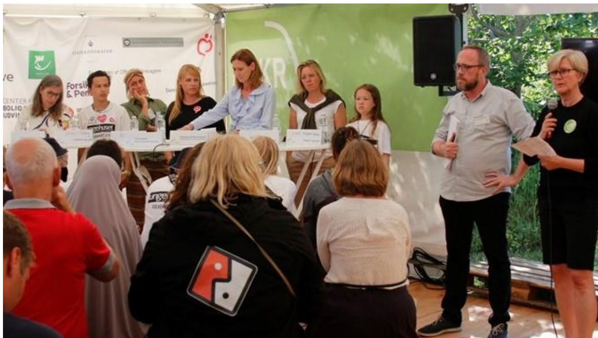
SSP-Samrådet, Landsforeningen af Ungdomsskoleledere og DKR afholdt sammen eventen "Fra udstødt til fællesskab"

gennemførelse af events, da vi oplevede stor tilbageholdenhed fra det politiske niveau ligesom ministerier og styrelser bliver sat på "stand by". SSP-Samrådet gennemførte dog som planlagt to events "Fra udstødt til fællesskab" (torsdag) og "SSP-samarbejdet mod år 2025" (fredag) med gode og faglig kompetente debattører og indlægholdere. SSP-Samrådet deltog endvidere i en række andre events omkring Ungdomskriminalitetsnævnet, Forebyggelse af unges rygning og alkoholforbrug, Cost/benefit ved forebyggelse. Disse var afviklet af forskellige samarbejdspartnere ligesom det i lighed med tidligere år blev til en masse god og konstruktiv netværksarbejde.